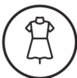
Diseño de vestuario