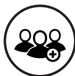
Nombre de la compañía