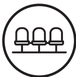
Sala de estreno