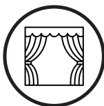
Nombre de la obra